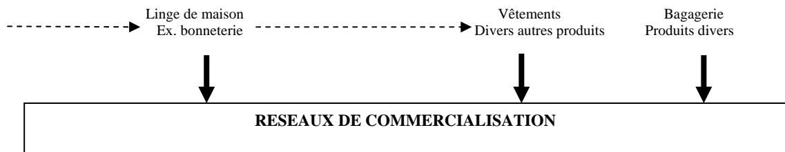
Figure 2. Cartographie de la filière